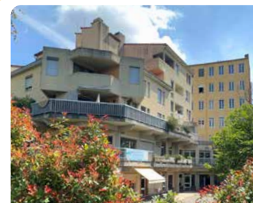
CENTRE SOCIAL DE LA GRAND'CÔTE (Lyon 1 er )

Annexe du Centre Social Pernon Les Laricios - 18 Rue Pernon – 69004 04 78 29 90 44