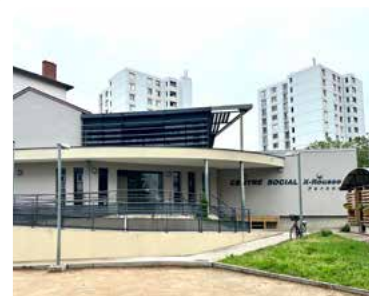
CENTRE SOCIAL DE PERNON (Lyon 4 ème )

27 rue Pernon – 69004 LYON 04 78 29 90 44 pernon@cs-croixrousse.org